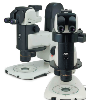
SMZ18 / SMZ25

Революційна оптика стереомікроскопів SMZ18/25 забезпечує найвищий в світі коефіцієнт збільшення 25:1, безпрецедентну роздільну здатність і яскраві флуоресцентні зображення.