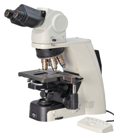
Серія ECLIPSE Ci

Серія мікроскопів ECLIPSE Ci відрізняється гнучкою функціональністю і широкими можливостями з оснащення для забезпечення різноманітних потреб спеціалістів для клінічних і дослідницьких лабораторій. Лінійка пропонує моделі з галогенним або світлодіодним освітленням, а також револьвером об'єктивів, що перемикається натиском на клавішу.