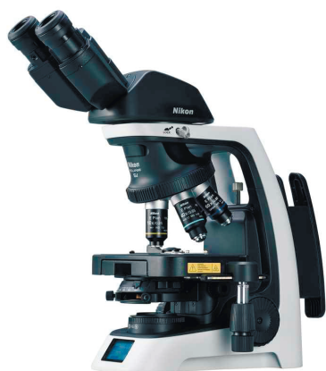
НОВИЙ ECLIPSE Si

Ергономічна модель ECLIPSE Si забезпечує комфорт і точність та розроблена для спеціалістів, що проводять багато годин за мікроскопом. Органи управління розташовані таким чином, щоб мінімізувати зайві рухи та забезпечити розслаблене положення тіла. Завдяки системі автоматичного налаштування яскравості робота за мікроскопом стає швидшою та простішою.