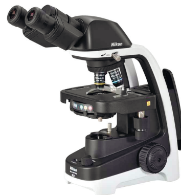
НОВИЙ ECLIPSE Ei

Нові мікроскопи ECLIPSE Ei з унікальним дизайном пропонують легке вирішення рутинних задач завдяки простоті в управлінні. Рівномірне світлодіодне освітлення забезпечує правильну передачу кольорів. Продуманий дизайн надає можливість налаштувати мікроскоп під себе за допомогою розширених регулювань фокусу, окулярів та предметного столика.