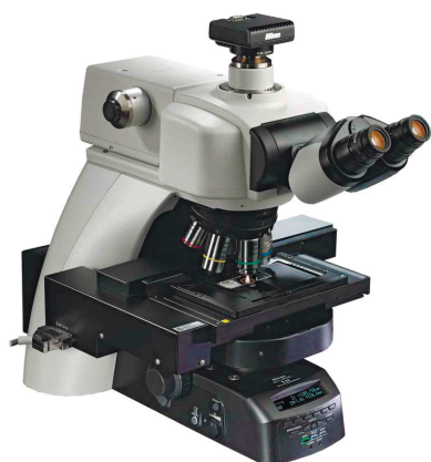
Серія ECLIPSE Ni

Серія дослідницьких мікроскопів ECLIPSE Ni з можливістю повної моторизації має відмінні оптичні характеристики, які здатні реалізувати будь-які сучасні методи спостереження навіть для найскладніших досліджень. У поєднанні із оригінальним програмним забезпеченням NIS-Elements мікроскопи перетворюються на справжні робочі станції, що здатні виконувати необхідний Вам перелік задач.